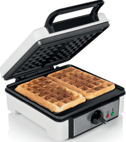
Waffle iron 01.132397.01.001

PARTS DESCRIPTION / ONDERDELENBESCHRIJVING / DESCRIPTION DES PIÈCES / TEILEBESCHREIBUNG / DESCRIPCIÓN DE LAS PIEZAS / DESCRIÇÃO DOS COMPONENTES / DESCRIZIONE DELLE PARTI / BESKRIVNING AV DELAR / OPIS CZĘŚCI / POPIS SOUČÁSTÍ / POPIS SOUČASTI / ОПИСАНИЕ ЗАПЧАСТІ