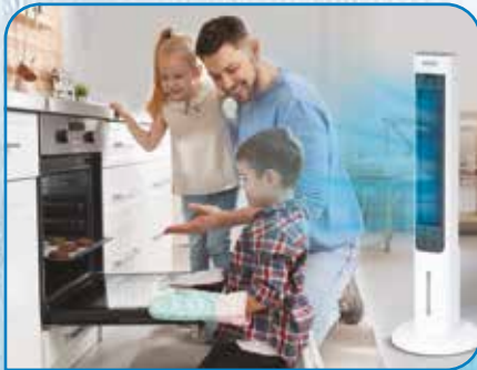
Jederzeit erfrischende Abkühlung in Küche & Wohnzimmer