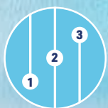
3 Geschwindigkeits- und Kühlstufen