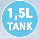
Kühlt & erfrischt mit reinem Wasser