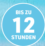
Laufleistung pro Tankfüllung